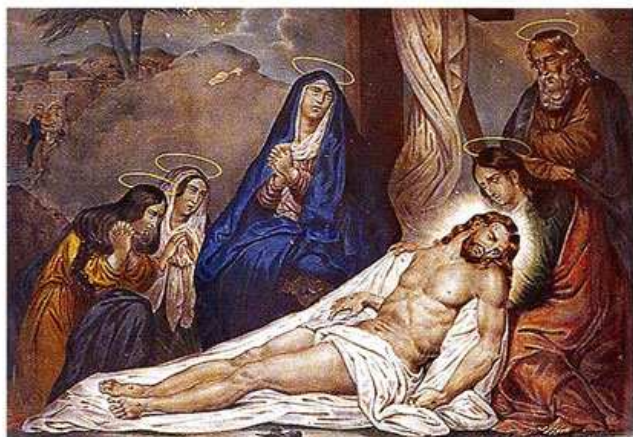
TREIZIÈME STATION DE CHEMIN DE CROIX XIX e siècle

Gravure rehaussée à l'aquarelle et bois doré Église de la Nativité-de-la-Vierge